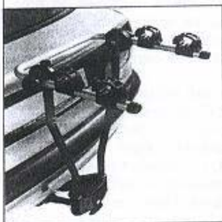
Fotografía nº 3