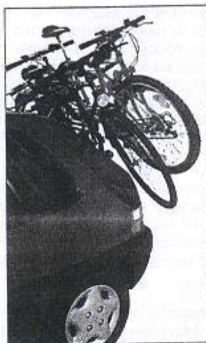
Fotografía nº 4