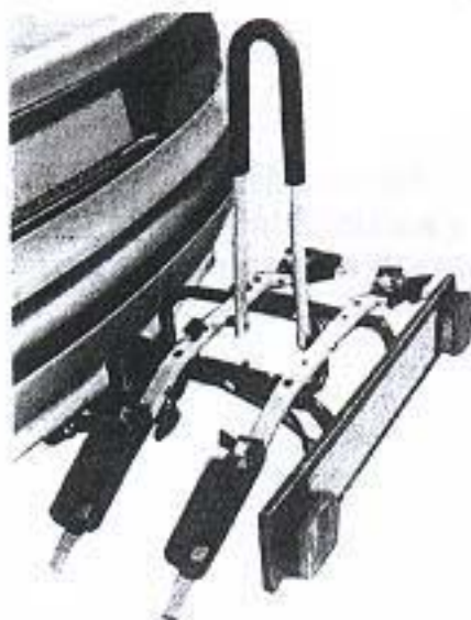
Fotografía nº 2